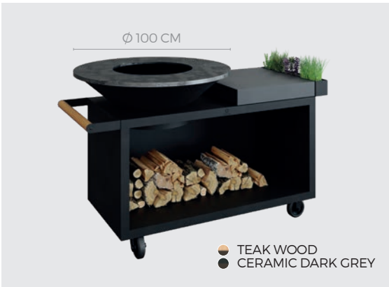
OFYR ISLAND BLACK 100 PRO

SKU OIB-100-PRO-TW OIB-100-PRO-CD EAN CODE 7061255378378 7112133682206