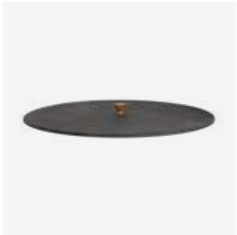
142 | Cover Black 85