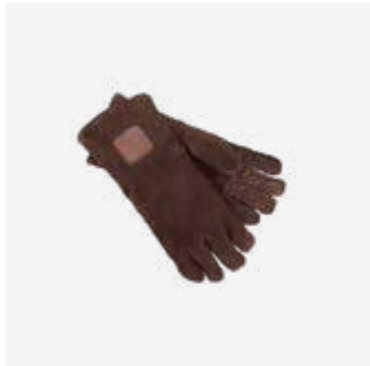
180 | Gloves Brown