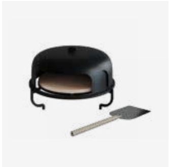
170 | Pizza Oven 85