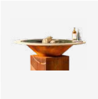
184 | Fire Guard Ring 85