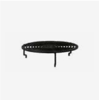
148 | Grill Round 85