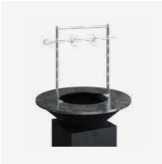
174 | Rotisserie Set