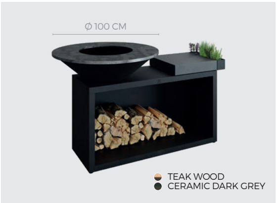
OFYR ISLAND BLACK 100