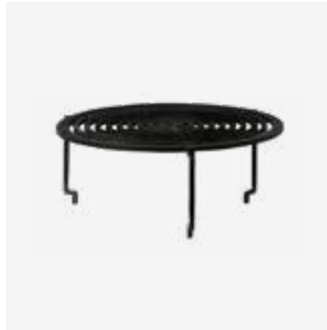
148 | Grill Round XL