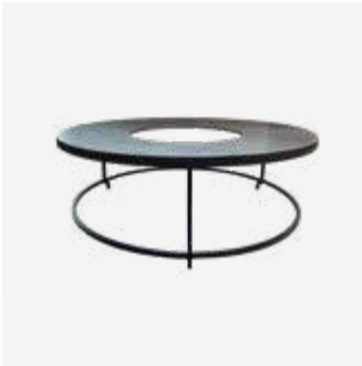
162 | Plate Extension Set XL