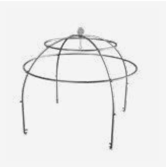
164 | Cage XL