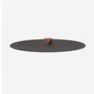
140 | Snuffer Black XL