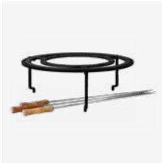
152 | Brazilian Grill Set XL