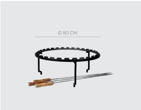
OFYR HORIZONTAL SKEWERS SET XL